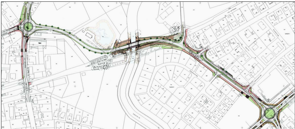
Auszug aus Gesamtlageplan