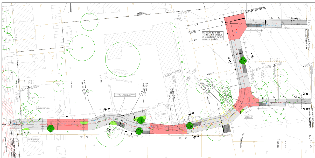
Auszug aus dem Gestaltungsplan

der Grünanlagen die familienfreundlichen Intentionen der kirchlichen Trägerschaft. Die hochwertige Lage des Wohngebietes unterstreichend konnte das ursprüngliche Klostertor in Teilen erhalten werden. So konnte für den ortskundigen Bürger nach Durchquerung eines Baumtores das Befinden, sich im abgeschiedenen Klostergarten direkt im Grünen aufzuhalten, erhalten werden und erfolgreich der städtebauliche Nutzen der Flächen erschlossen werden.