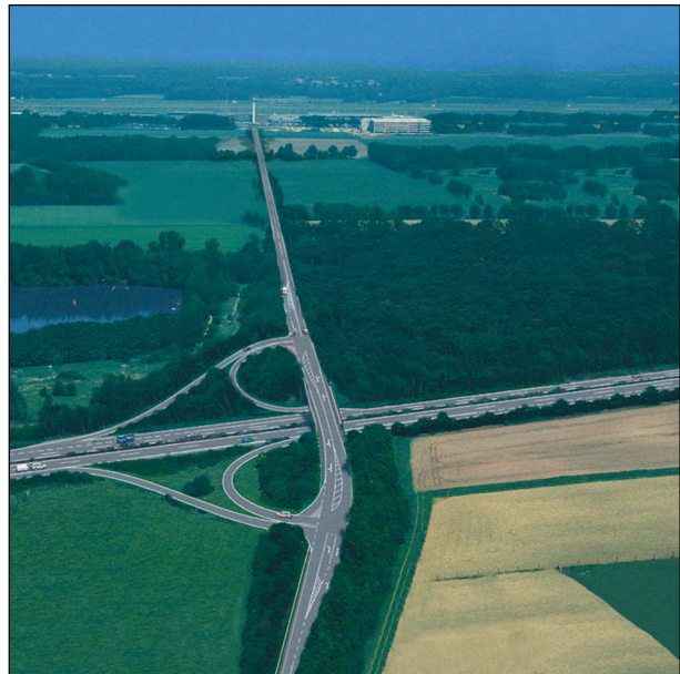
Fotomontage K 1n/BAB A1

Der Ausbau des Internationalen Flughafens Münster/Osnabrück (FMO) ist das wichtigste Verkehrsprojekt im Münsterland. Mit der weiteren Entwicklung des FMO verknüpft die Region unmittelbar die Erwartung eines nachhaltigen wirtschaftlichen Wachstums. Im Münsterland-Programm 2000 wurde dem Projekt Flughafen ausbau mit seinen einzelnen Bausteinen die allerhöchste Priorität eingeräumt.