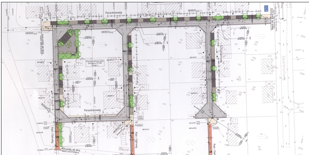
Auszchnitt aus Lageplan Gestaltung

Neben der technischen Erschließung wurde bei den Planungen großer Wert auf eine ansprechende Gestaltung der Verkehrsflächen gelegt, die wirtschaftlich vertretbar ist und das Miteinander der zukünftigen Anwohner berücksichtigt.