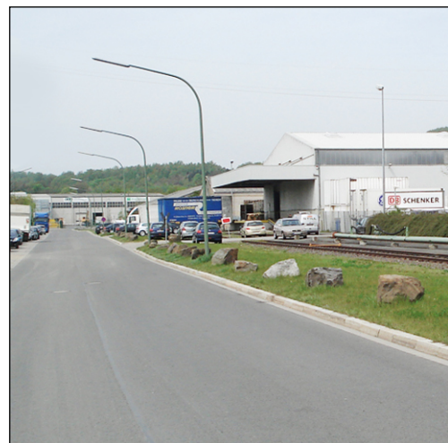
Die Elbestraße nach Fertigstellung