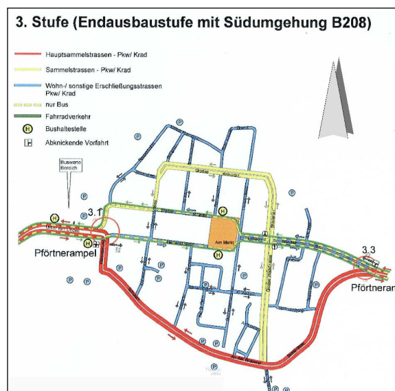
Führung Pkw abseits der sensiblen Altstadtbereiche

Die Realisierung einer Ortsumgehung B 208n ist jedoch nur sehr langfristig und auch nur sehr ortsfrem zu erwarten. Da der (auf die B 208n verlagerungsfähige) Anteil des überörtlichen Durchgangsverkehrs zudem nur 13 % des ein- und ausstrahlenden Kfz-Verkehrs der Altstadt beträgt, war für die Inselstadt ein alternatives Entlastungskonzept zu entwickeln.