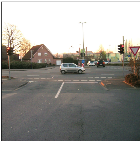
Ausfahrt vom Gelände des Bürgerhofes

Die K + K Klaas + Kock B. V. & Co. KG beabsichtigte die Errichtung eines Verbrauchermarktes am Standpunkt des „Alten Bürgerhof“ in Warendorf. Dieser befand sich am August-Wessing-Damm auf Höhe des bestehenden Einkaufszentrums „Bürgerhof“. Im Rahmen einer Machbarkeitsstudie sollte geklärt werden, ob durch den geplanten Verbrauchermarkt eine Erschließung über den August-Wessing-Damm unter verkehrstechnischem Blickwinkel ohne bauliche Maßnahme grundsätzlich möglich ist. Der Verbrauchermarkt war mit einer Verkaufsfläche von 1420 m 2 geplant, und sollte durch die bestehende Anbindung an den August-Wessing-Damm angeschlossen werden. Nach Ermittlung der maßgebenden Verkehrsstärken, durch Hochrechnungen ausgewerteter Zählraten und einer Verkehrserzeugungsberechnung des geplanten Verbrauchermarktes war die verkehrliche Leistungsfähigkeit der bestehenden Anbindung nachzuweisen. Aufgrund der nicht gegebenen Leistungsfähigkeit der bestehenden Lichtsignalanlage fand eine Optimierung dieser statt, wodurch eine ausreichende Leistungsfähigkeit unter den maßgeblichen Verkehrsbelastungen erreicht werden konnte.