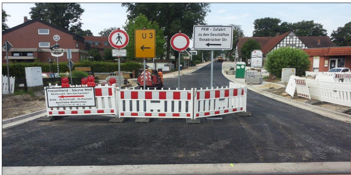
Beginn der Baustrecke mit Bahnübergang

Neben der Straßenbauplanung wurde die Wassertechnik durch das pbh geplant und bauleitungsmäßig betreut.