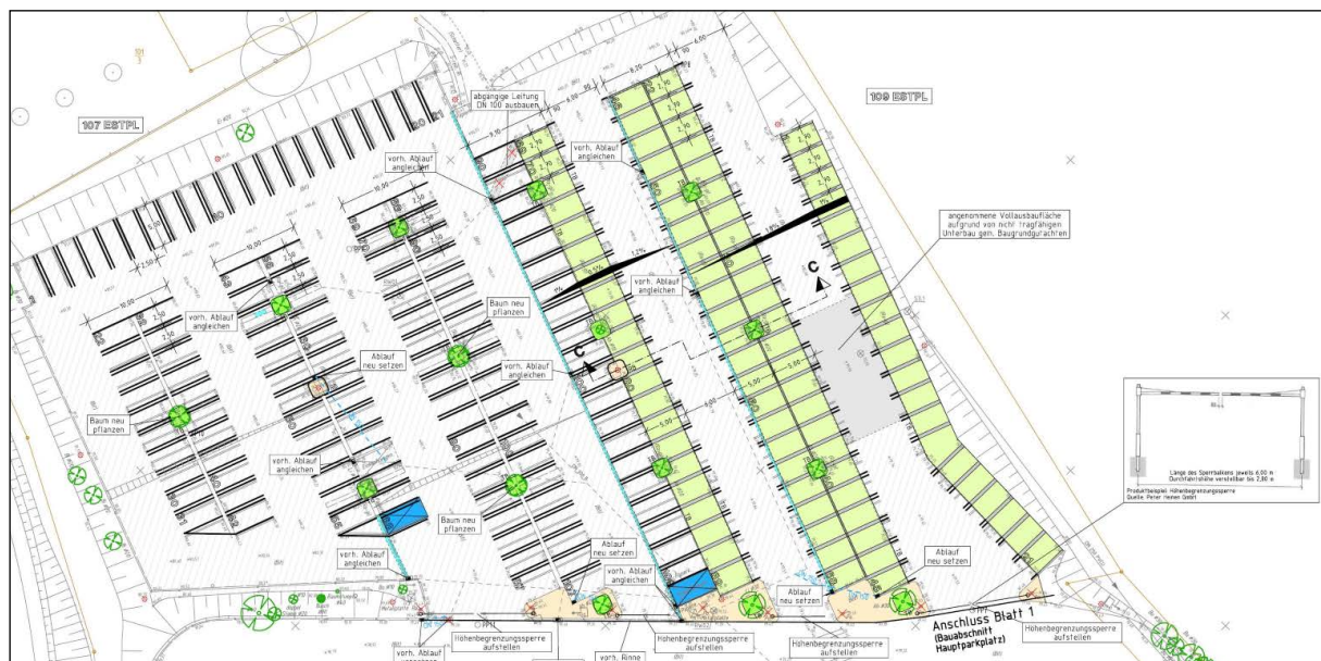
Bauabschnitt Parkplatz 2

Nach der Umgestaltung konnten noch 476 Stellplätze nachgewiesen werden. Die gem. Baugenehmigung erforderliche Anzahl von 397 Stellplätzen wurde somit eingehalten.