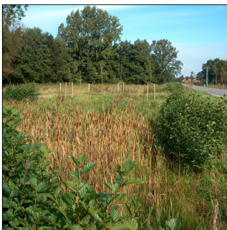
Foto Rückhaltebecken, ca. 1,5 Jahre nach Errichtung

Die K 61n dient zur verkehrlichen Entlastung der Ortslage Wettringen. Dieser 900 m lange Kreisstraßenabschnitt zwischen dem Welberger Damm/K 65 und der B 70 wurde in enger Zusammenarbeit mit dem Auftraggeber und den Genehmigungsbehörden geplant. Hierbei wurden u.a. auch die vorhandenen hydrologischen Verhältnisse – hoher Grundwasserstand, geringe Leistungsfähigkeit der Vorfluter – berücksichtigt. Dieses spiegelt sich in der Höhenlage der Straße und der Errichtung eines Regenrückhaltebeckens wider.