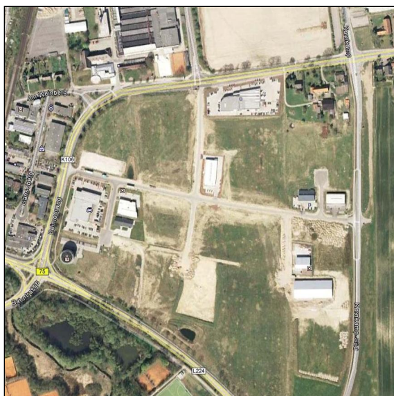
Luftbild des Gewerbegebietes

Aufgrund der positiven Entwicklung des Gewerbegebietes Beimoor Süd wurden wir nach der Herstellung der Teilerschließung mit der Planung und Bauüberwachung des Endausbaus beauftragt. Die Planung ist an geänderte Richtlinien und Normen sowie an die vorhandene Nutzung anzupassen. Aufgrund der Erfahrungen wurde die Straßen- und Stellplatzbreite an den hohen LKW-Anteil angepasst.