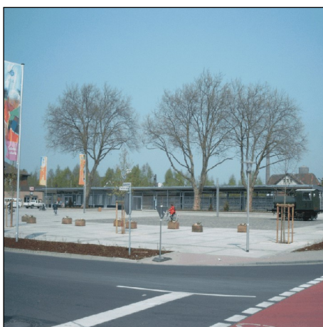
Radstation am Bahnhofsvorplatz

Die Stadt Gronau war in 2003 Ausrichter der Landesgartenschau. Das Gelände lag in unmittelbarer Nähe zum Bahnhof Gronau. Das Umfeld am Bahnhof Gronau wurde auch vor dem Hintergrund der Wiederinbetriebnahme der Bahnstrecke Gronau-Enschede attraktiver gestaltet und städtebaulich und verkehrlich neu geordnet. Als verknüpfendes Element zwischen Innenstadt und den nördlich der Bahntrasse gelegenen Stadtteilen kommt dem Bahnhof und seinem Umfeld große Bedeutung zu. Die Parkplatzgestaltung wurde mit Zuwendungen des Landes Nordrhein-Westfalen zur Stadterneuerung gefördert.