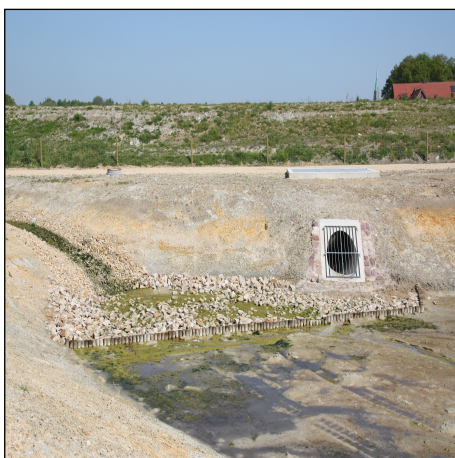
Regenrückhaltebecken / Maßnahme des ABK

Die Gemeinde Altenberge hat ein kanalisiertes Einzugsgebiet von rd. 260 ha. Die rd. 70 km lange Kanalisation unterteilt sich jeweils zu einem Drittel in Misch-, Schmutz- und Regenwasserkanal. Neben 12 Schmutzwasserpumpwerken unterhält die Gemeinde 13 Regenrückhaltebecken, 3 Regenklärbecken sowie 4 Regenüberlaufbecken.