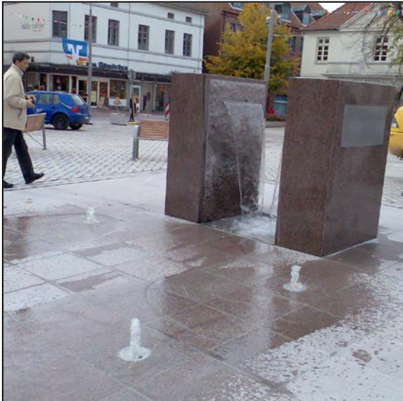
Marktplatz mit Brunnenanlage

Das Ziel der Umgestaltung war, den Marktplatz der Stadt Ratzeburg wieder als Mittelpunkt erleben zu können, als Treffpunkt für städtisches Leben, als Herz und Zentrum von Ratzeburg sowie als Reaktivierung des Geschäftslebens mit: