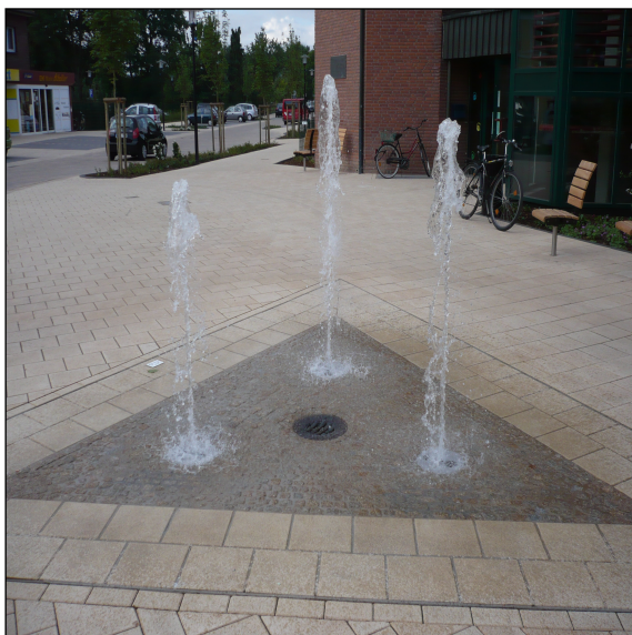
Wasserspiel vor der Schule