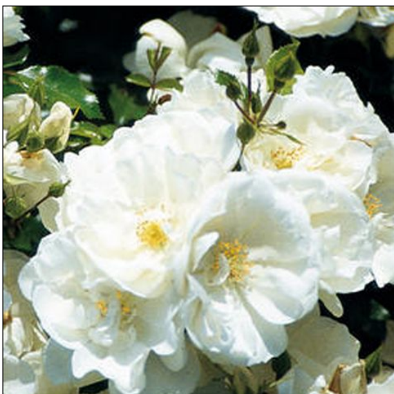
Pflanzendetail (widerstandsfähig/lange blühend)

So entstand eine neue eingegrünte Verkehrsanlage, die sich positiv in das „Dorfbild“ integriert.