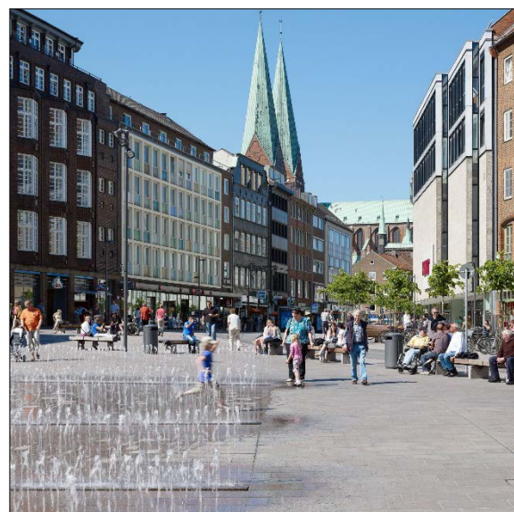
Platz nach Fertigstellung

Foto: Bild-Raum | Stephan Baumann, 24.05.12