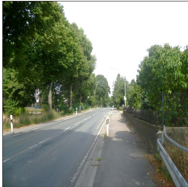
Landesstraße 89 in Hasbergen

Die Niedersächsische Landesbehörde für Straßenbau und Verkehr beabsichtigte den Ausbau der Osnabrücker Straße (L 89) in Hasbergen. Im Zuge der vom Planungsbüro Hahm durchgeführten Planungen wurde die Sanierungsbedürftigkeit der Regen- und Schmutzwasserkanalisation in diesem Bereich überprüft. Dafür wurden Kamerabefahrungen durchgeführt, bewertet und die gefundenen Schadstellen in Lageplänen festgehalten. In Kombination mit einer hydraulischen Bewertung, auf Grundlage eines Generalentwässerungsplanes und den vor Ort ermittelten Einzugsgebieten, konnten detaillierte Sanierungsmaßnahmen festgelegt werden.