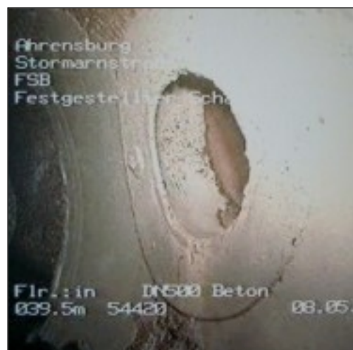
Stützen nach erfolgter partieller Sanierung