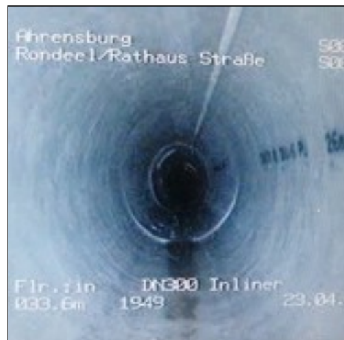
Renovation durch Liningverfahren

In der Ausführungsplanung werden dann die Videos gesichtet und das Verfahren endgültig festgelegt. Dabei wird besonderer Wert auf die Qualitätssicherung gelegt.