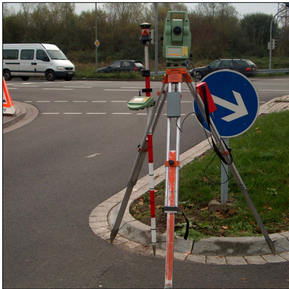
Vermessung mit Leica TPS 1100