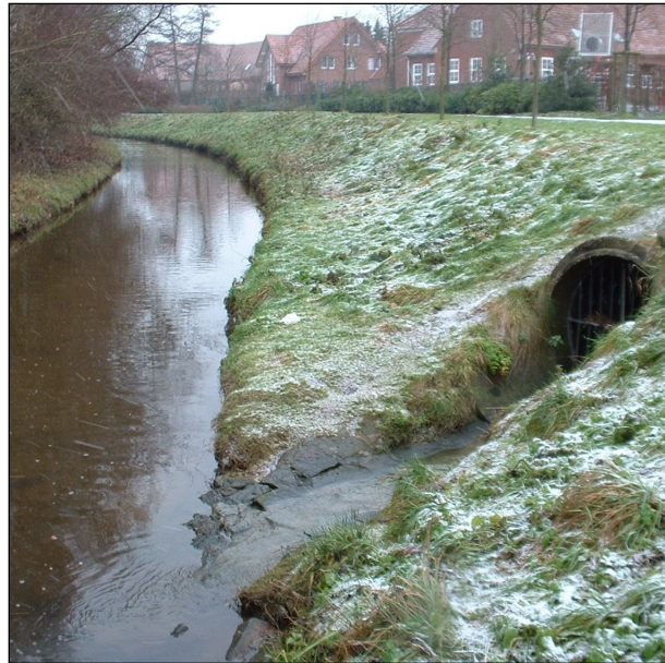
Hydraulische Überlastung des Gewässers durch Einleitungen