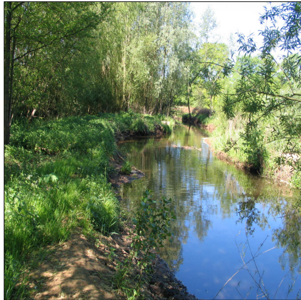
Ladberger Mühlenbach im Bereich einer durchgeführten Maßnahme