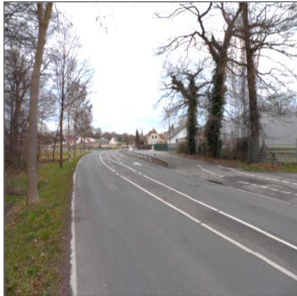
Tecklenburger Straße (K 305)

Im Zuge einer Straßenbaumaßnahme sollte die Sanierungsbedürftigkeit der Regen- und Schmutzwasserkanalisation im Bereich der Tecklenburger Straße überprüft werden. Zum Feststellen des baulichen Zustandes wurde dazu eine Kamerabefahrung gesichtet und fachlich ausgewertet. Außerdem wurden umfangreiche hydraulische Kanalnetzmodellierungen mit dem Programm Hystem/Extran durchgeführt, um die hydraulische Belastung der Regenwasserkanalisation festzustellen.