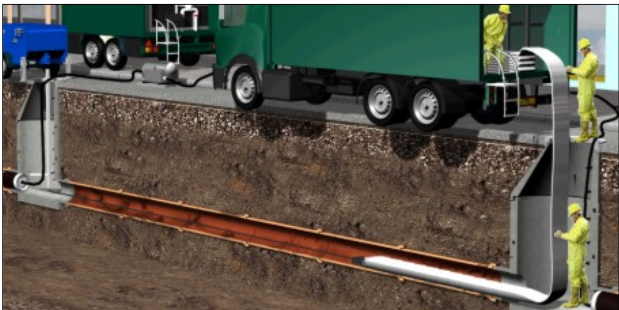
Sanierung mittels Inliner

Der Sanierungsumfang wurde auf rd. 300.000,00 € geschätzt.