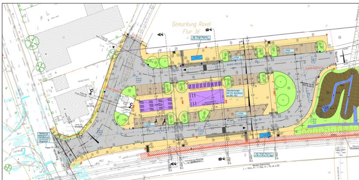
Lageplan des gesamten Baufeldes

und Reisenden eine attraktivere Nutzung öffentlicher Verkehrsmittel zu bieten. Insbesondere ist dafür neben einer Park- + Ride-Anlage mit separat ausgewiesenen Behindertenstellplätzen, eine teils überdachte und vor Vandalismus geschützte Bike- + Ride-Anlage sowie die Errichtung von Bushaltestellen geplant. Die gesamte Anlage wird barrierefrei angelegt.